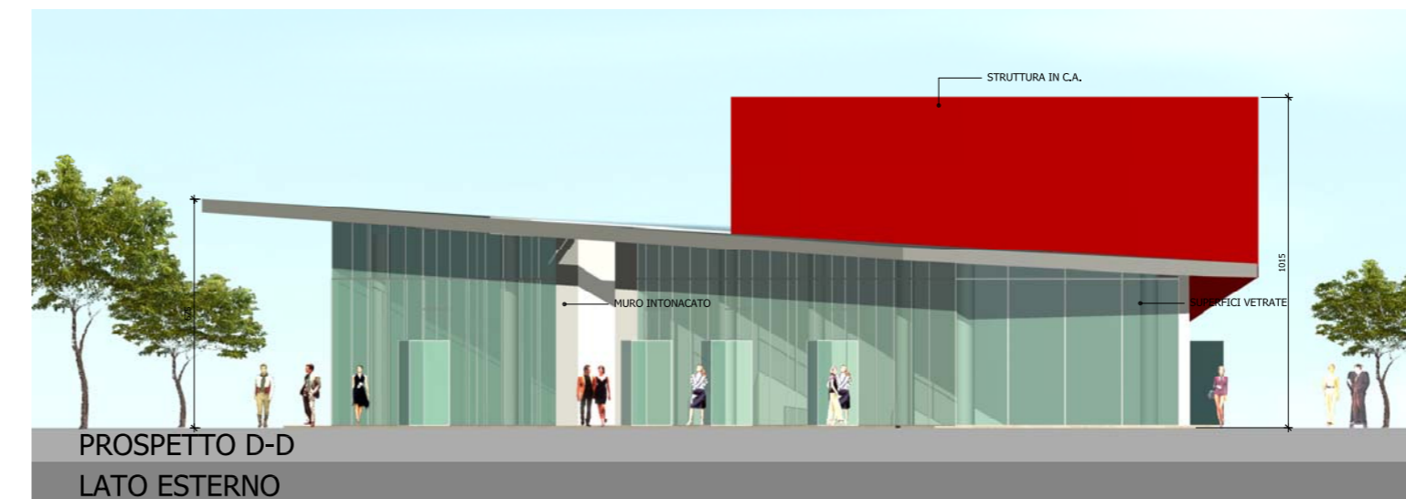
PROSPETTO D-D LATO ESTERNO