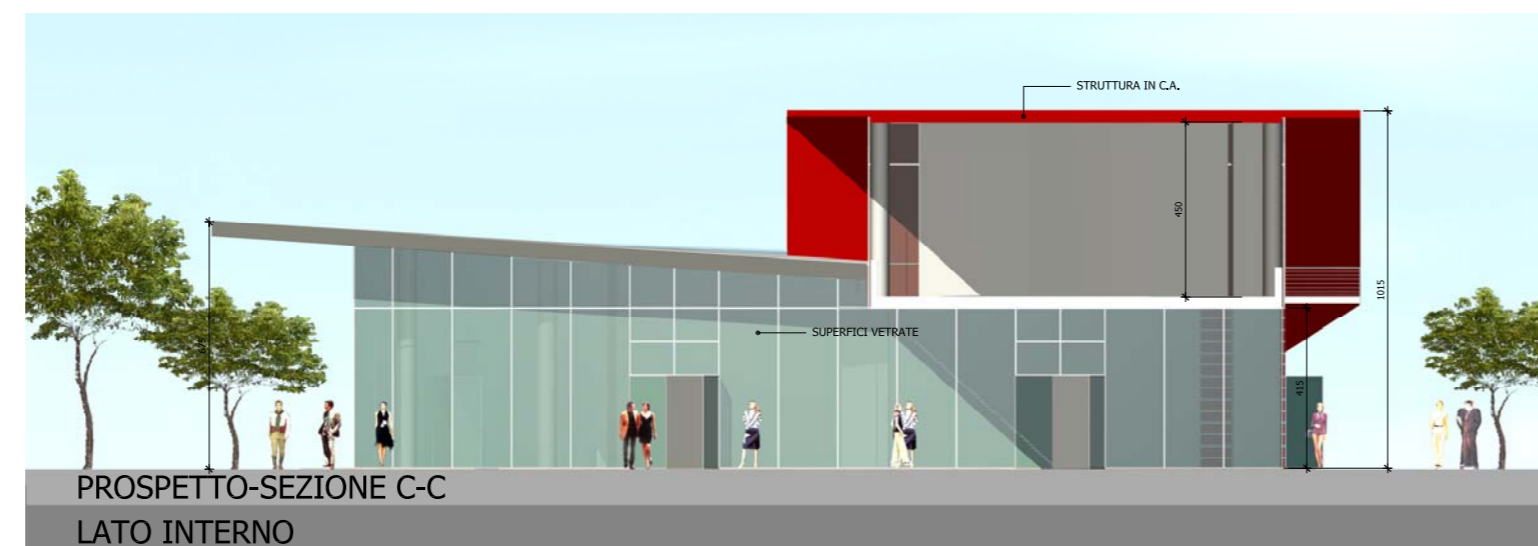
PROSPETTO-SEZIONE C-C LATO INTERNO