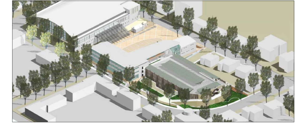
PROGETTO DEFINITIVO ESECUTIVO

REALIZZAZIONE "CHIAVI IN MANO" DEL PARCHEGGIO MULTIPIANO PER AUTOVETTURE DA ERIGERSI NELL'AREA COMPRESA TRA I VIALI FIUME, DELLA VITTORIA E PARTIGIANI IN PESARO