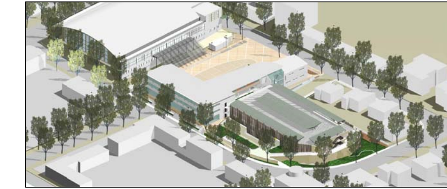
PROGETTO DEFINITIVO ESECUTIVO

REALIZZAZIONE "CHIAVI IN MANO" DEL PARCHEGGIO MULTIPIANO PER AUTOVETTURE DA ERIGERSI NELL'AREA COMPRESA TRA I VIALI FIUME, DELLA VITTORIA E PARTIGIANI IN PESARO